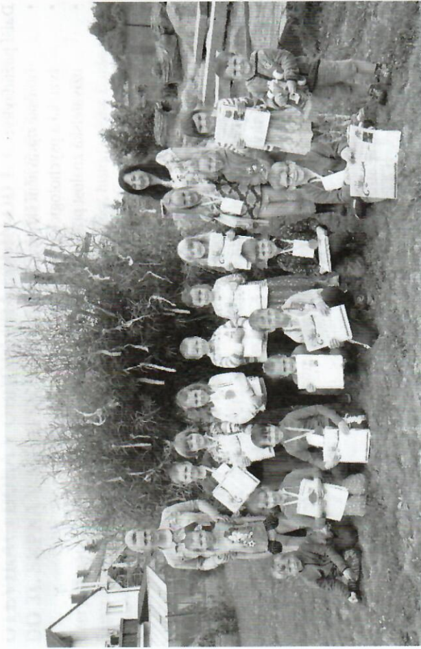
Třída Soviček.

užili. Pro děti byl připraven dopolední program v podobě soutěží ve třídách i na školní zahradě. Dále se také uskutečnilo fotografování předškoláků na tablo, které je vystaveno na Masarykově náměstí ve Velké Bíteši. Třídní tablo by mělo symbolizovat začátek nové cesty dětí do základní školy.