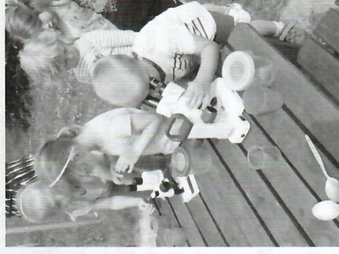
Děti s mikroskopem.

Na závěr si všichni zahráli pohybovou hru, při které se pořádně proběhli po celé zahradě. Tento velice poutavý a zajímavý program pro děti byl pořádán společností MOST Výsočiny, o.p.s. Velké Meziříčí v rámci realizace projektu MAP II rozvoje vzdělávání v OPR Velké Meziříčí, registrační číslo projektu: CZ.02.3.68/0.0/0.0/17_047/0009959