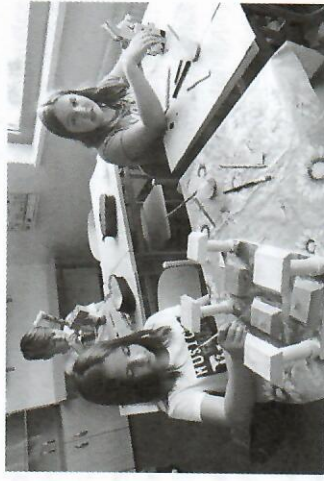
„Kutilové“ - děti vyrábějí ze dřeva.

Žáci naší školy se během výuky i po výuce ve školní družině zapojili do akce „Kutilové“, kterou pořádala organizace MAS MOST Výsočiny o. p. s., do níž se zapojilo celkem 20 škol. Děti měly za úkol zlepšovat svoje manuální a technické dovednosti při vyrábění výrobků ze dřeva. Vše bylo umístěno na „Výstavě dřevěných výrobků dětí a žáků z MŠ a ZŠ Velkomeziříčska a Bítešska“ ve výstavní síni Jupiter klubu ve Velkém Meziříčí.